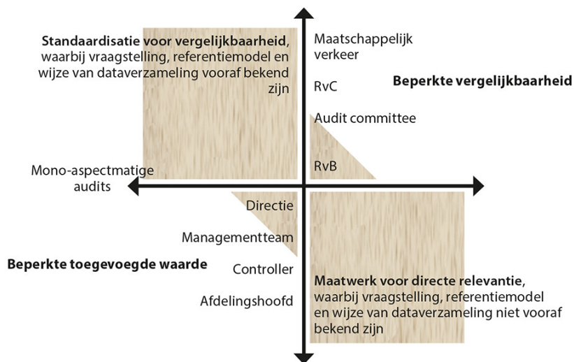
Figuur 2. Onderscheid in type audits o.b.v. beoogde gebruikers (het 'kruis')

De verschillen in beoogde gebruikers (op een continuüm intern/extern) leiden tot een belangrijk onderscheid in type audits. Dit onderscheid is de mate waarin meer standaardisatie of juist meer maatwerk mogelijk en gewenst is. Ook dit onderscheid is een continuüm en hangt samen met het aantal in het onderzoek te betrekken aspecten. Bij een beperkt aantal aspecten (bijvoorbeeld alleen de betrouwbaarheidsaspecten: juist en tijdig en dus volledig) is een meer gestandaardiseerde audit mogelijk. Bij een diversiteit aan veelal onderling concurrerende aspecten (bijvoorbeeld betrouwbaarheid én kosteneffectiviteit én flexibiliteit én klantgerichtheid, et cetera) is meer maatwerk gewenst en is standaardisatie nauwelijks mogelijk.