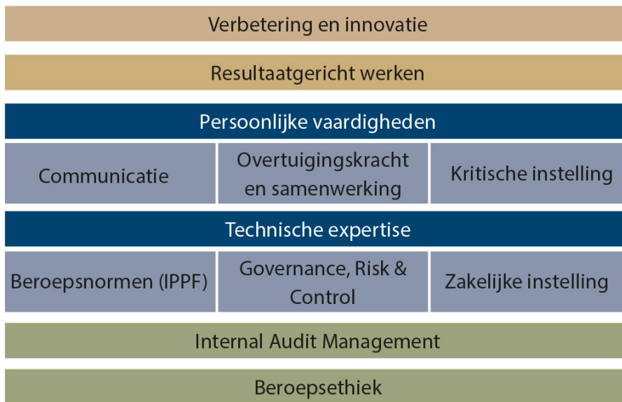
Figuur 1. Structuur van het competentieraamwerk en de samenhang van de onderdelen ervan.

Dit artikel gaat dieper in op een aantal competenties die minder uitvoerig zijn behandeld in de IPPF, te weten: zakelijk inzicht, overtuigingskracht & samenwerking en verbetering en innovatie. Dit zijn de competenties waar stakeholders de nadruk op leggen en die vanuit een traditionele auditopleiding naar mijn mening niet altijd voldoende worden belicht.