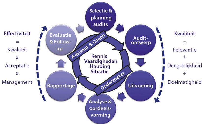
Figuur 1. Rollen en competenties in relatie tot het auditproces